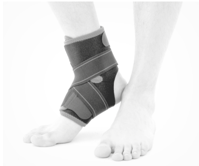
4. PL: Gotowy wyrób. EN: Product is ready to use.