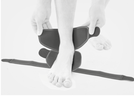
1. PL: Załóż ortezę na nogę. EN: Put the brace on the leg.